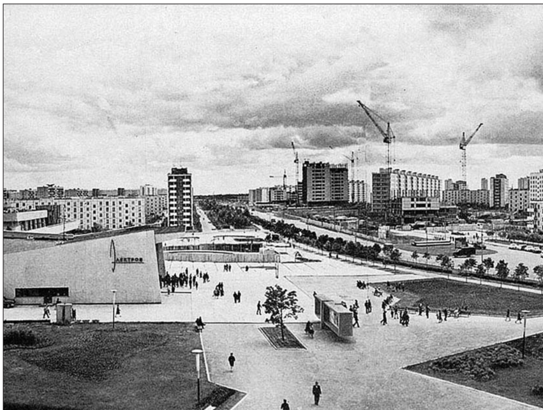
Вид на 2-й микрорайон

материалы по истории края — в том числе археологические коллекции — и истории Солнечногорского района. Второй зал — военно-исторический. Третий представляет историю микроэлектроники.