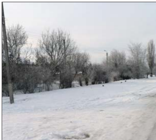
По рассказам очевидцев, здесь были похоронены расстрелянные фашистами люди

тели села весной 1942 года. Многие сельчане во время полевых работ на своем участке находят гильзы, каски советских и немецких солдат, фрагменты разорвавшихся снарядов. Все эти свидетельства войны хранятся в нашем школьном музее Боевой Славы. Но тем не менее нам, современным подросткам, очень трудно всё это связать с событиями семидесятилетней давности. Слишком беспечными мы стали, забыли, каким трудом досталась нашему народу мирная жизнь. Но есть люди, которые пережили войну и оккупацию и не понаслышке знают, какой она была страшной и каким долгим и тяжёлым был путь к Победе. И их знания и чувства для нас особенно важны. Я назову несколько аргументов в пользу этого утверждения.