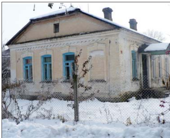
В этом доме жили немецкие офицеры

Анализ информации полностью подтвердил мою гипотезу. Да, жизнь моих односельчан и всех, кто пережил войну и фашистскую оккупацию, можно назвать подвигом.