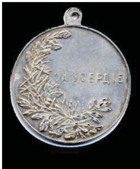
Медаль «За усердие»

За год до начала Первой мировой войны, 10 августа 1913 года, был утверждён новый «Статут императорского Военного ордена Святого Великомученика и Победоносца Георгия, принадлежащего к сему ордену Георгиевского креста и причисляемых к тому же ордену Георгиевского оружия и Георгиевской медали».