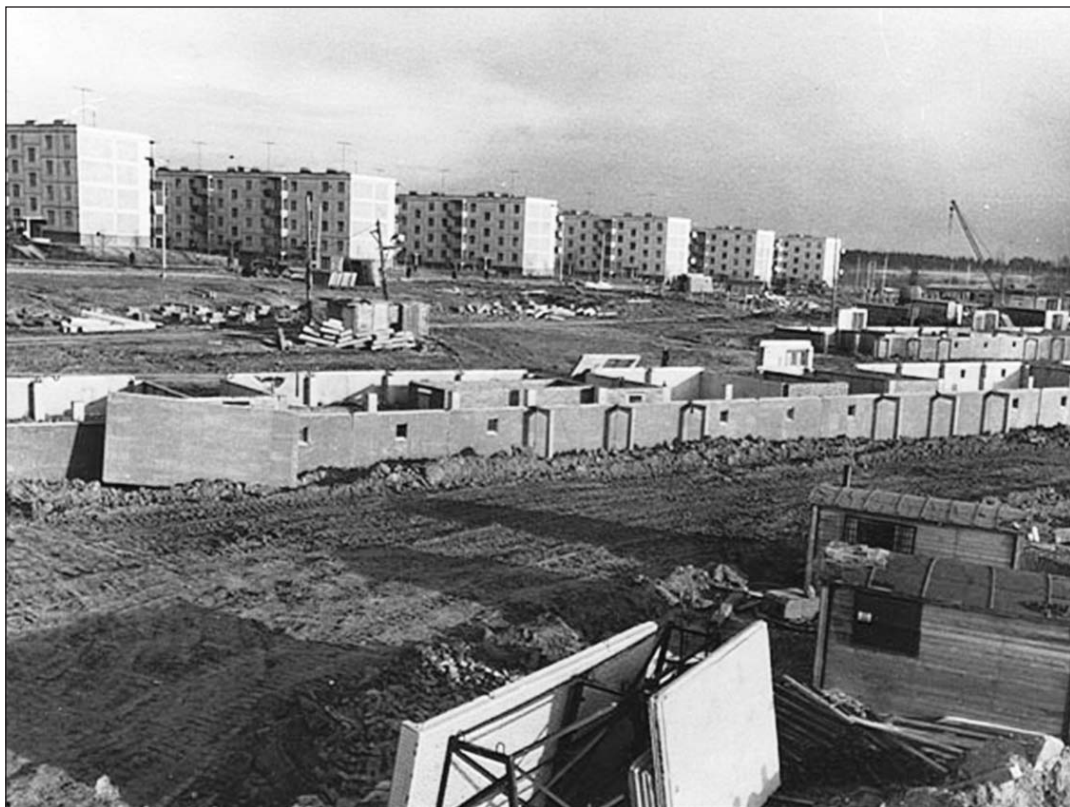
Начало строительства 1-го микрорайона Зеленограда