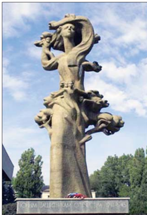
Юным защитникам Отечества