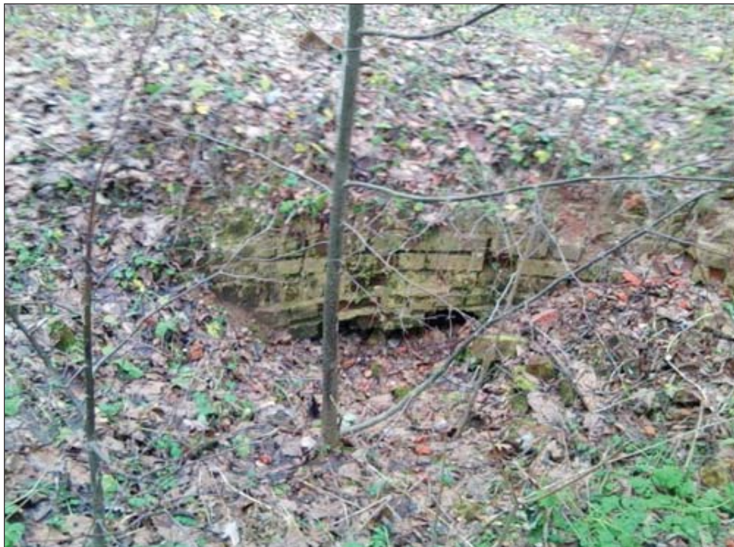
Фундамент разрушенного барского дома

нам ксерокопии имеющихся у них материалов из истории села Преображенского. И в мае 2012 года я получила ответ и ксерокопии материалов из следующих книг: «Смоленские усадьбы» (авторы А.Б. Чижков и Н.Г. Гурская) и «Четыре века смоленских усадеб» (авторы Л.А. Верховская и Н.В. Деверилина). Из этих материалов я узнала, что наша деревня Митино за свою историю имела несколько названий: Устье, Преображенское, Митино.