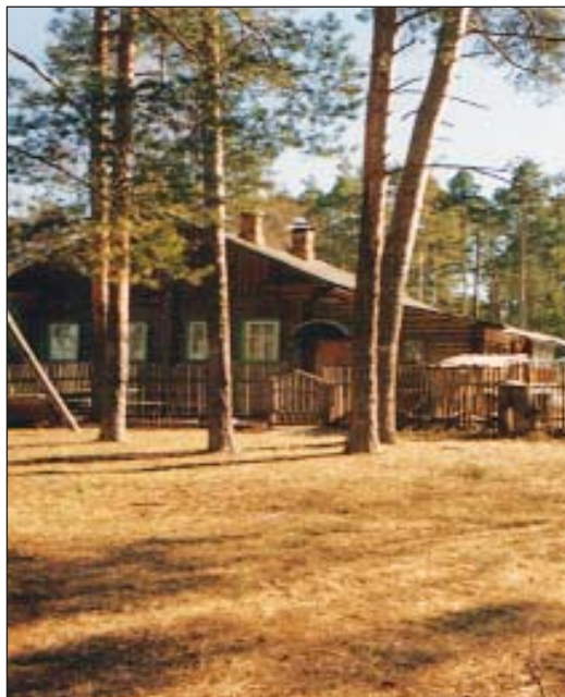
Домик, в котором жил М.М. Пришвин в годы войны, с. Усолье

Время, проведённое в Усолье, — важный период в жизни Пришвина, это время его перерождения как художника. Михаил Михайлович пересматривал здесь своё творчество. Из беззаботного «певца природы» он превратился в реального участника многих событий. Его всё больше тянуло к человеку. Не просто нетронутая природа, а человек в этой природе — вот главное. Это подтверждают его произведения, написанные здесь.