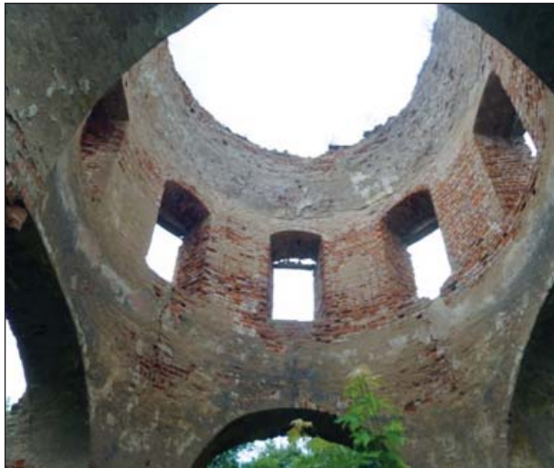
Руины церкви, д. Митино (бывшее с. Преображенское)