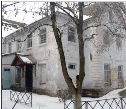
В годы войны здесь был штаб и столовая оккупантов. Сейчас — контора СХП им. К. Маркса

2. Война — это страшно, но видеть её детскими глазами ещё страш-